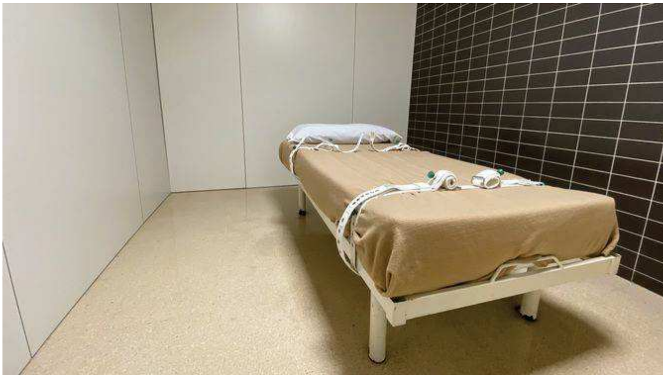
Un llit amb corretges de contenció (CCMA)

El Departament de Salut no té el recompte de quantes persones es lliguen , ni quanta estona duren les contencions, ni cada quan es revisen.